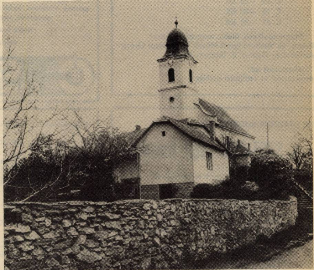
A borsodi földvár már csak egy nagyobb domb a templom mögött. De a kerítés a vár egykori kőveiből épült.

Úgy gondolom, ez bőles program, a városias ellátás és infrastruktúra megszerzése, de a falusias csönd, tisztaság, nyugalom megtartása. Gondok mint mindenhol, Edelenyben is vannak. De a lakosság, a lo-kálpatrióták városépítő-óvó szeretete reményt ad a program megvalósításának sikeréhez.